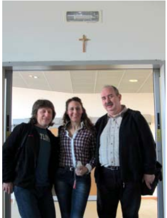
W salach lekcyjnych zawieszono są krzyże

W czwartek odwiedziliśmy Istituto Alberghiero Gallarate w mieście Monza. Jest to wyższa szkoła średnia z różnymi specjalnościami np. reklama i grafika komputerowa, hotelarstwo i gastronomia, liceum matematyczno – przyrodnicze oraz liceum klasyczne (dyrektor mówił, że organizacja procesu nauczania w takim zespole jest bardzo trudna). W szkole jest kilka pracowni komputerowych wyposażonych w komputery typu Macintosh oraz PC (po około 30 komputerów w pracowni). W każdej sali lekcyjnej znajduje się tablica interaktywna i rzutnik multimedialny (połączony sieciowo ze szkolnym centrum multimedialnym).