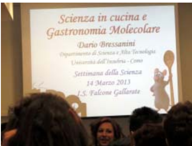
W szkole odbywała się konferencja „Nauka w kuchni - gastronomia molekularna”