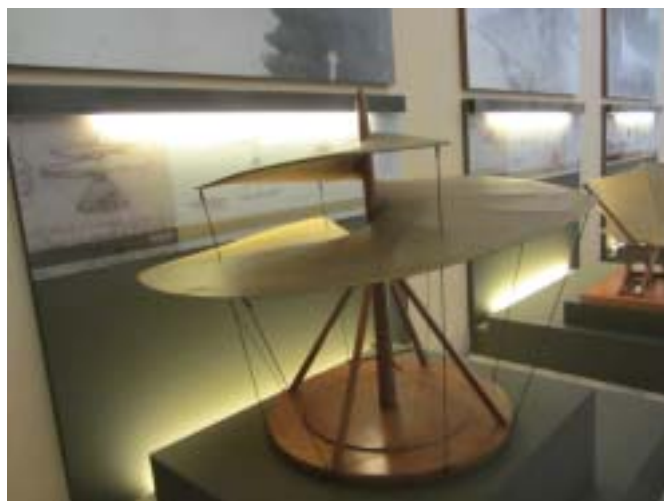
Muzeum naukowe im. Leonardo da Vinci

Drugiego dnia gościliśmy w fabryce śrub „Fontana”. Temat wizyty to „Przykłady wykorzystania ICT i nauki na rynku pracy”. Po południu pojechaliliśmy na Uniwersytet w Mediolanie, zwiedziliśmy Centrum Biotechnologii i Dyfuzji CUSMIBIO, gdzie zademonstrowano nam wykorzystanie technologii informacyjnej do przekazywania efektów badań naukowych.