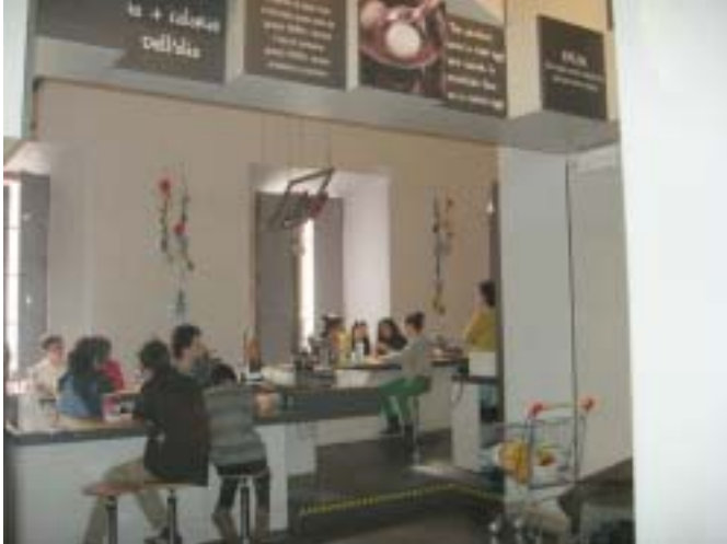
Jest ono bardzo chętnie odwiedzane przez dzieci i młodzież.

Trzeciego dnia zwiedzaliśmy w Mediolanie Muzeum naukowe im. Leonardo da Vinci, które stanowi bardzo interesujące połączenie muzeum i odpowiednika polskiego Centrum Nauki Kopernik.