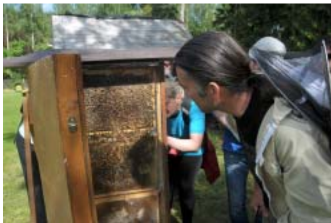
Obserwacja pracy pszczół w szklanym ulu.

Małgorzata Bernat Przedszkole Miejskie nr 20 w Olsztynie