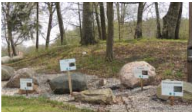
Lapidarium głazowe w Niepublicznej Szkole Podstawowej w Słupach