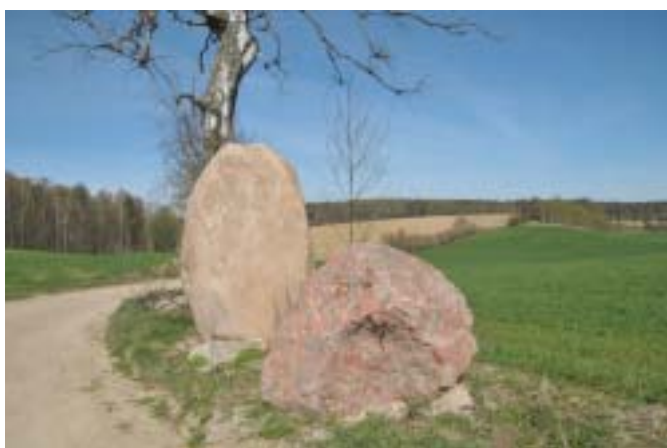
Głazy narzutowe w Lubstynku