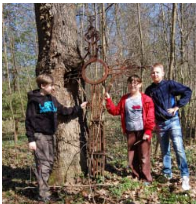
Cmentarz w Dobrocinie – kuty żelazny krzyż wrośnięty w drzewo

Dariusz Luczak Szkoła Podstawowa w Małdytach