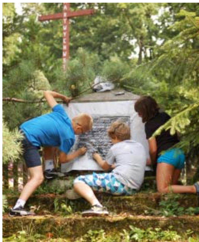
Cmentarz w Dobrocinie – odczytywanie napisu na obelisku rodziny von Domhardt