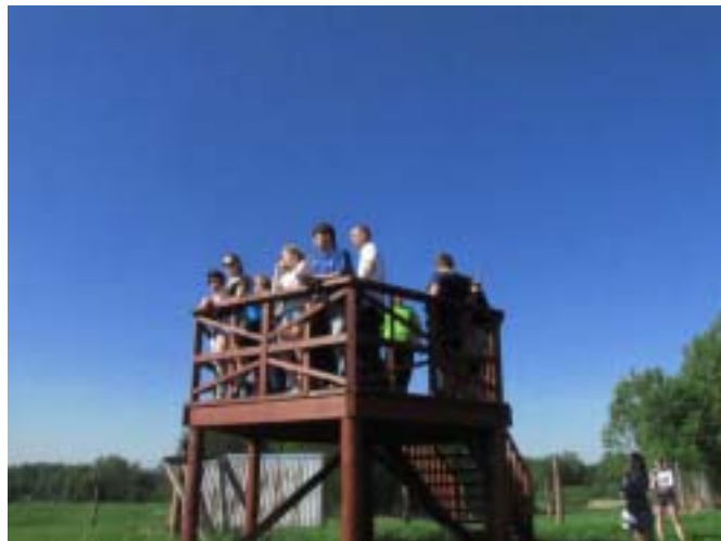
Młodzież Zespołu Szkół Licealnych w Morągu razem z młodzieżą Specjalnego Ośrodka Szkolno-Wychowawczego w Szymanowie na wieży widokowej w Ośrodku

Od blisko roku uczniowie ZSL współpracują również ze Specjalnym Ośrodkiem Szkolno-Wychowawczym w Szymanowie. Uczniowie obu szkół spotykają się, co kilka tygodni i wspólnie nabywają nowe umiejętności i doświadczenia. Nawiązują się również nowe przyjaźnie. Wszystko rozpoczęło się od wspólnego kolędowania,