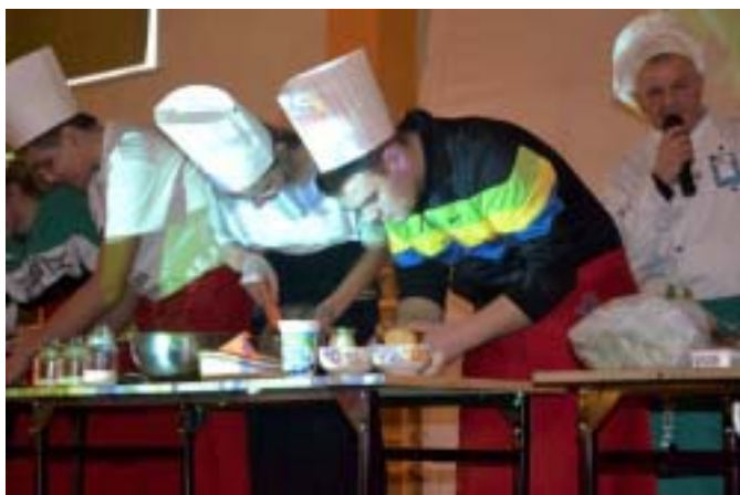
Uczniowie gimnazjum w roli kucharza