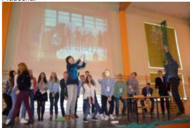
Szczęśliwe zakończenie „Wycieczki po karierę”

Na koniec na scenie pojawili się uczniowie Zespołu Szkół i w rytm lubawskiej wersji teledysku Pharrella Williamsa „Happy”, tańczyli przekonując młodszych gości, że nauka w Zespole Szkół w Lubawie może być przyjemna i radosna.