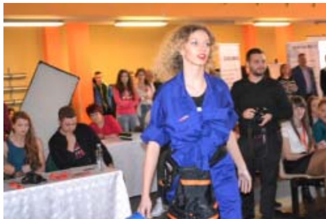
Strój elektryka, Warsztaty Szkolne Zespołu Szkół w Lubawie.

Pierwszą część imprezy zakończył TOP JOB - został zawodowcem, czyli pokaz mody branżowej lokalnych przedsiębiorców w wykonaniu uczniów Zespołu Szkół w Lubawie, w konwencji znanego programu TOP MODEL. W rolę zawodowych modelek i modeli wcieliły się uczennice Zespołu Szkół w Lubawie. Niesamowitą atrakcją imprezy była maskotka Różowej Pantery, która jest żywą reklamą firmy stolarskiej CONSTRUCT i maskotką drużyny sportowej.