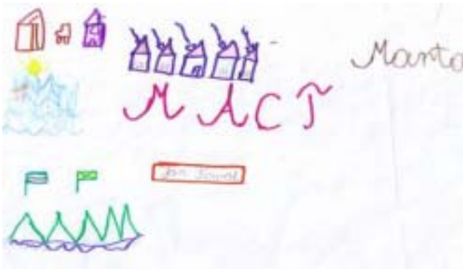
Rys. 2 Piktogram do fragmentu wierszyka „Wielka litera”