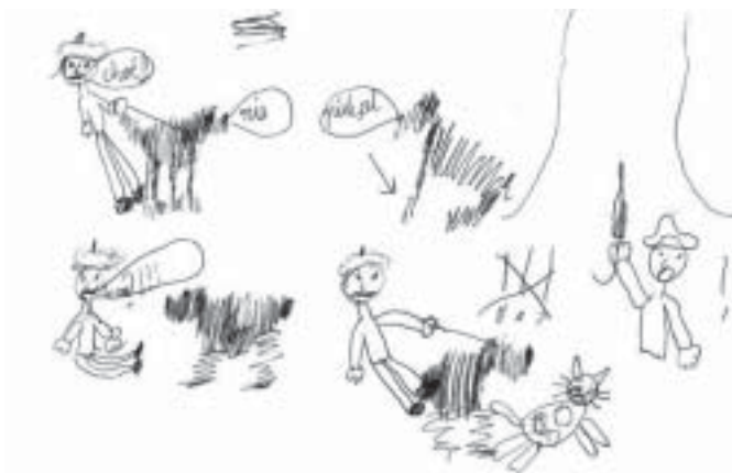
Rys. 1 Piktogramy do fragmentu wiersza D. Gellner „Spacerek”. Autor piktogramów - Bartek Spikert lat 9