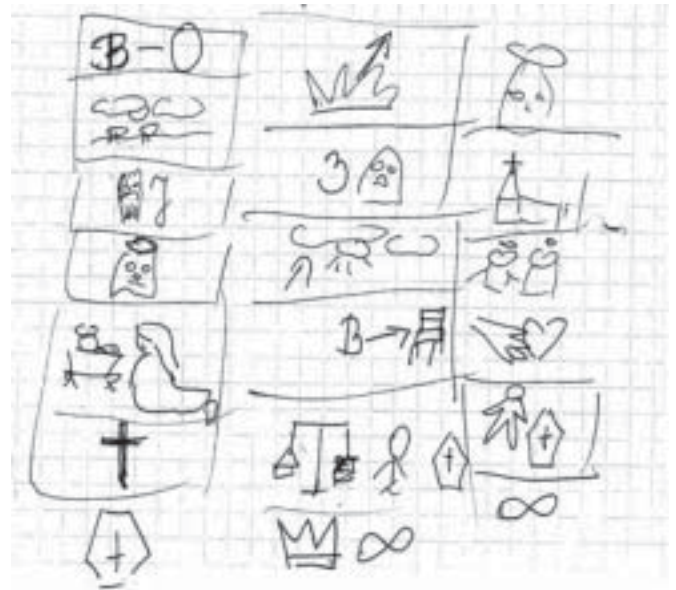
Rys. 3 Skład Apostolski