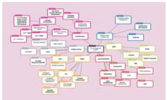
Rys. 5 Mapa myśli w aplikacji Popplet na temat Co pomaga uczyć się? Autor Agnieszka Spikert