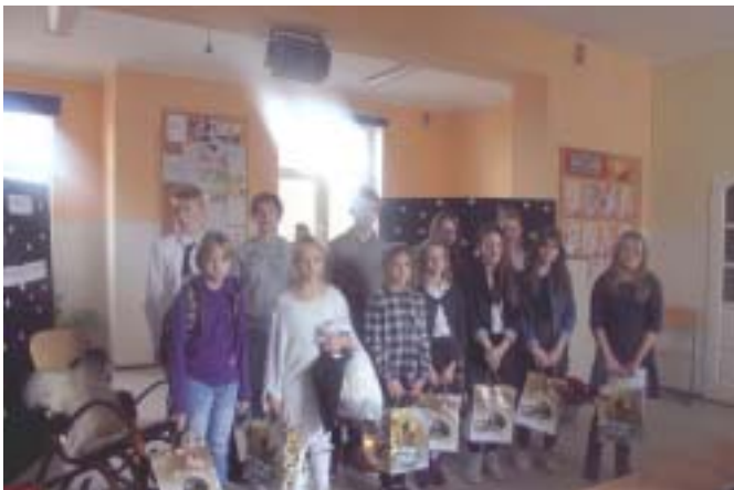
Zwycięzcy i wyróżnieni w Gminnym Konkursie Literackim „Opowieść wigilijna wierszem i prozą”

Z niecierpliwością przeglądałam je w drodze na uniwersytet. Nie wierzyłam własnym oczom – były naprawdę dobre. Nie pomyliłam się. Komisja konkursowa była pod ogromnym wrażeniem. Nie mogła zdecydować, jak rozdzielić nagrody. Dodawała kolejne wyróżnienia, żeby nie skrzywdzić żadnego zdolnego dziecka i nie zapomnieć o żadnym mądrym tekście.