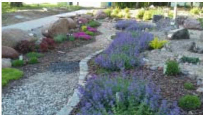
Wiosna w Geoogrodzie

Projekt koncepcyjny Geoogrodu, wykonany przez uczniów pod kierunkiem nauczyciela, stanowił również pracę konkursową zgłoszoną w kategorii projekt użytkowy w Konkursie Prac i Projektów Praktycznych Uczniów Szkół Średnich organizowanym przez Radę Federacji Stowarzyszeń Naukowo- Technicznych NOT. Zaproponowano w nim różne formy elementów dydaktycznych m.in. kolekcję głazów narzutowych, różnych naturalnych kruszyw i odpowiednio dobranej roślinności. W szkole zawodowej, w której kształcą się w zawodach: budowlanych, drogowych, architektury krajobrazu, surowiec skalny jako materiał, jest podstawowym elementem budowlanym. Wiedza z zakresu geografii i ekologii koreluje z wiedzą przekazywaną na przedmiotach zawodowych, przez co umożliwia uczniom rozpoznawanie, zrozumienie i wykorzystywanie tych surowców w pracy zawodowej. Teren, na którym została odpowiednio dobrana roślinność, jest miejscem pokazowym do prowadzenia zajęć z przedmiotów przyrodniczych. Dzięki tym elementom uczniowie będą dostrzegać na co dzień elementy krajobrazu naturalnego i wskazywać ich wykorzystywanie w obiektach budowlanych, dostrzegać piękno środowiska przyrodniczego oraz potrzebę naturalnego i estetycznego