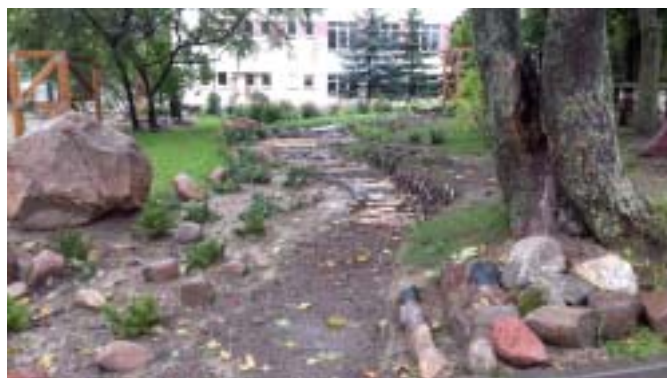
Ścieżka sensoryczna w Geoogrodzie