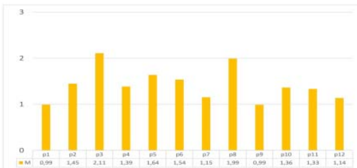
Ryc. 1. Wyniki badania ankietowego młodzieży

Temat zdrowia psychicznego w ocenie uczniów jest raczej nieobecny wśród zagadnień omawianych w czasie zajęć szkolnych. Można zatem przyjąć, iż udzielane przez nich odpowiedzi odzwierciedlają poglądy utworzone nie tyle na podstawie usystematyzowanego i spójnego programu edukacyjnego, co przypadkowego i zróżnicowanego potocznego przekazu medialnego i osobistych doświadczeń. W tym kontekście najczęściej tworzą zbiór różnorodnych i sprzecznych opinii, które w uśrednionym wyniku znajdują się w przestrzeni między pozytywnymi i negatywnymi rozstrzygnięciami.