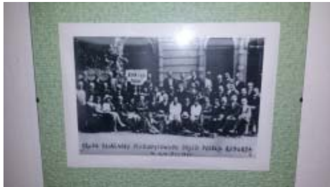
Zdjęcie przedstawia grupę polskich działaczy plebiscytowych przed polską resursą w Kwidzynie.

działalność plebiscytową, brak odpowiednio przygotowanych agitatorów i wreszcie zaangażowanie w wojnę z bolszewicką Rosją sprawiły, że strona polska była słabsza już na wstępie przygotowań do plebiscytu.