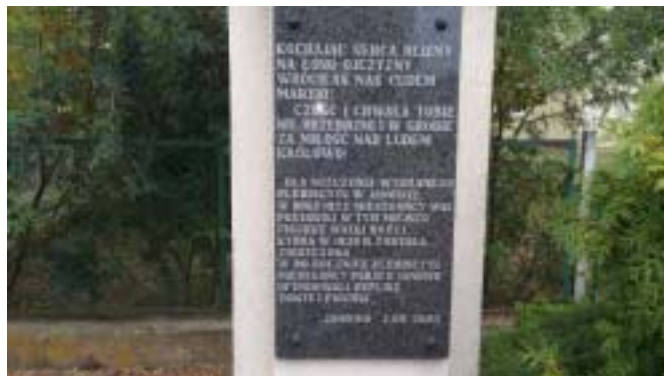
Tablica na figurce Matki Bożej w Janowie dla uczczenia przyłączenia Janowa i 4 innych wsi do Polski w wyniku plebiscytu.

W wyniku głosowania niemal cały obszar plebiscytowy pozostał w granicach Niemiec. Do Polski przyłączono jedynie 8 wsi. Na Mazurach - 3 wsie: Lubstyniek i Napromek (obecnie gmina Lubawa) oraz Groszki (obecnie gmina Rybno). W Groszkach na 74 oddane głosy, aż 69 było za Polską. W Lubstynku na 144 oddane głosy za Polską było 93. W Napromku na 88 głosujących na Polskę zagłosowało 45 osób. Na Powiślu - 5 wsi: Bursztynch - 126