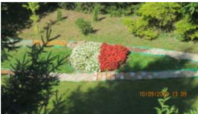
Szkoła Podstawowa w Staświnach - Flaga Polski w pełnym rozkwicie