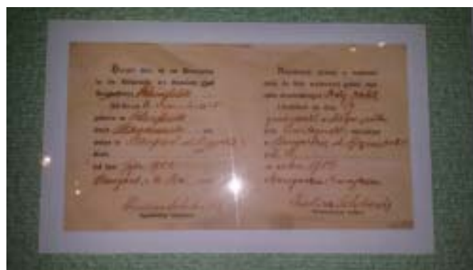
Wniosek o wpisanie na listę wyborczą.

Plebiscyt na Warmii, Mazurach i Powiślu wyznaczono na 11 lipca 1920 r. Obszar plebiscytowy podzielono na dwa okręgi: - kwidziński, obejmujący dzisiejsze powiaty: sztumski, suski oraz prawobrzeżna część powiatu malborskiego i kwidzińskiego, - olsztyński, obejmujący dzisiejsze powiaty na Warmii: olsztyński i południową część powiatu reszelskiego, oraz powiaty mazurskie: ostródzki, nidzicki, szczycieński, piski, mrągowski, ełcki, giżycki, olecki. Nadzór nad właściwym przebiegiem plebiscytu sprawowały neutralne Komisje Międzysojusznicze złożone z przedstawicieli zwycięskich państw: Anglii, Francji, Włoch i Japonii, jedna dla okręgu olsztyńskiego i druga dla okręgu kwidzińskiego.