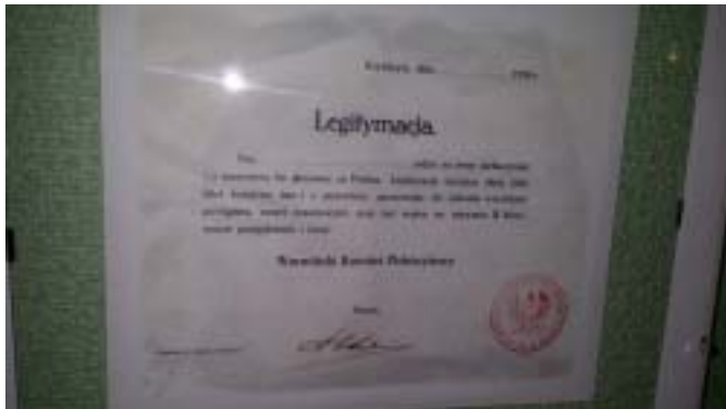
Legitymacja osoby pochodzącej z terenu plebiscytowego, a zamieszkałej poza nim, wystawiona przez Warmiński Komitet Plebiscytowy. Dokument ze zbiorów Izby Pamięci Narodowej w Szkole Podstawowej w Janowie.

interweniowania w czasie zajęć i wszczynanych burd na wiecach czy manifestacjach przedplebiscytowych. Wojska niemieckie miały opuścić obszary plebiscytowe w przeciągu 15 dni.