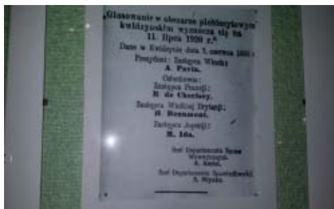
Obwieszczenie o zarządzeniu plebiscytu w okręgu kwidzińskim. Dokument ze zbiorów Izby Pamięci Narodowej w Szkole Podstawowej w Janowie.

Plebiscyt na Warmii, Mazurach i Powiślu wyznaczono na 11 lipca 1920 r. Obszar plebiscytowy podzielono na dwa okręgi: - kwidziński, obejmujący dzisiejsze powiaty: sztumski, suski oraz prawobrzeżna część powiatu malborskiego i kwidzińskiego, - olsztyński, obejmujący dzisiejsze powiaty na Warmii: olsztyński i południową część powiatu reszelskiego, oraz powiaty mazurskie: ostródzki, nidzicki, szczycieński, piski, mrągowski, ełcki, giżycki, olecki. Nadzór nad właściwym przebiegiem plebiscytu sprawowały neutralne Komisje Międzysojusznicze złożone z przedstawicieli zwycięskich państw: Anglii, Francji, Włoch i Japonii, jedna dla okręgu olsztyńskiego i druga dla okręgu kwidzińskiego.